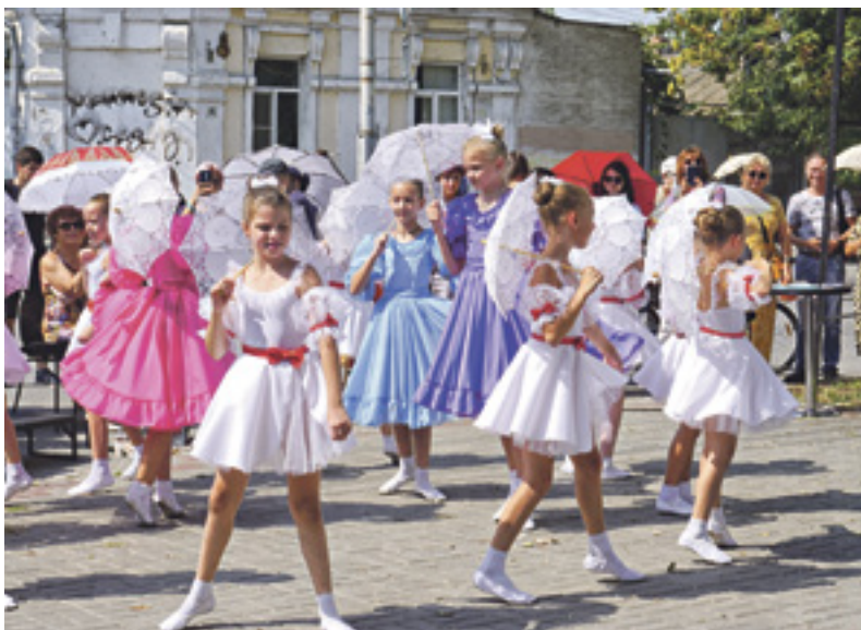
■ Танцующие девочки из студии «Грани»