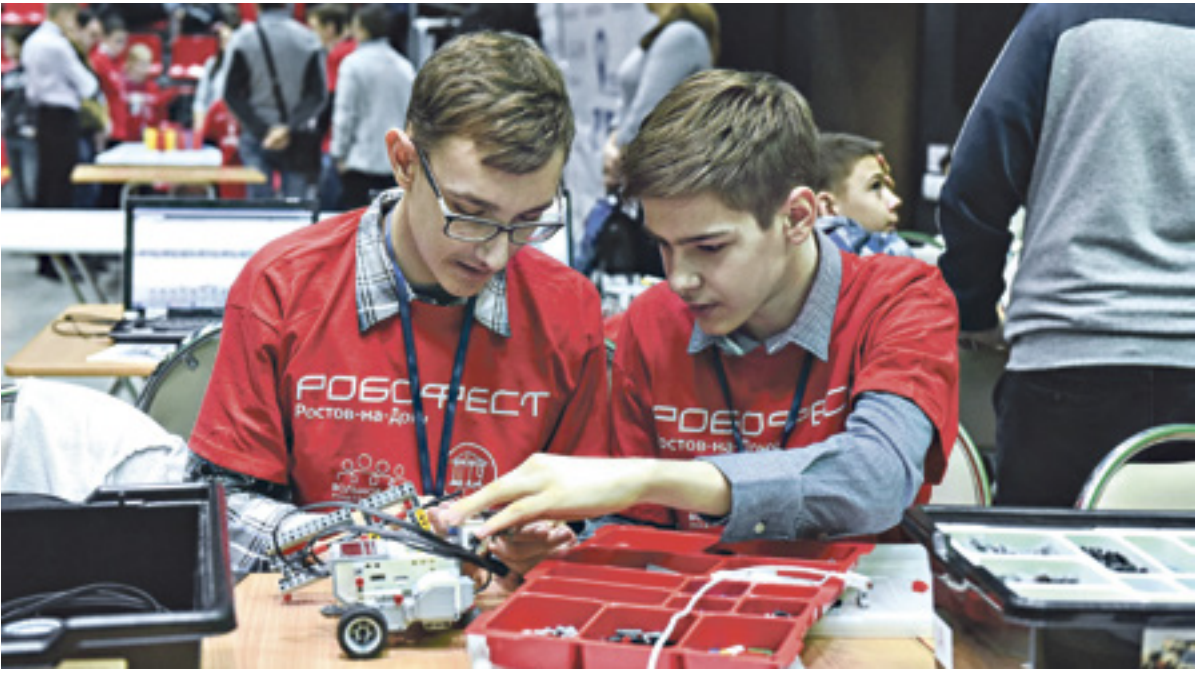
■ Сегодня в ростовском кванториуме занимаются 800 детей

– Чтобы у детей появился интерес, необходимо дать им возможность выбора. И не только в организациях дообразования, но и в обычной школе. В конце августа мы проведем образовательную сессию по вопросам организации качественного и, главное, востребованного у детей и родителей дополнительного образования. Областной модельный центр будет проводить мониторинг и инвента-