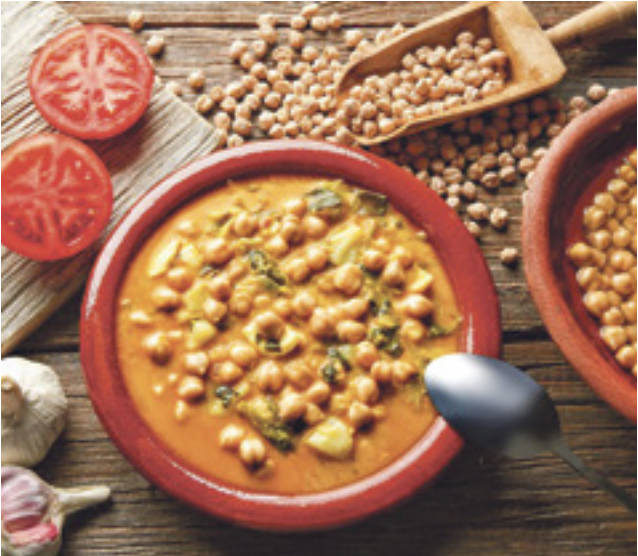
■ Производство нута на экспорт — направление для российского сельского хозяйства не новое